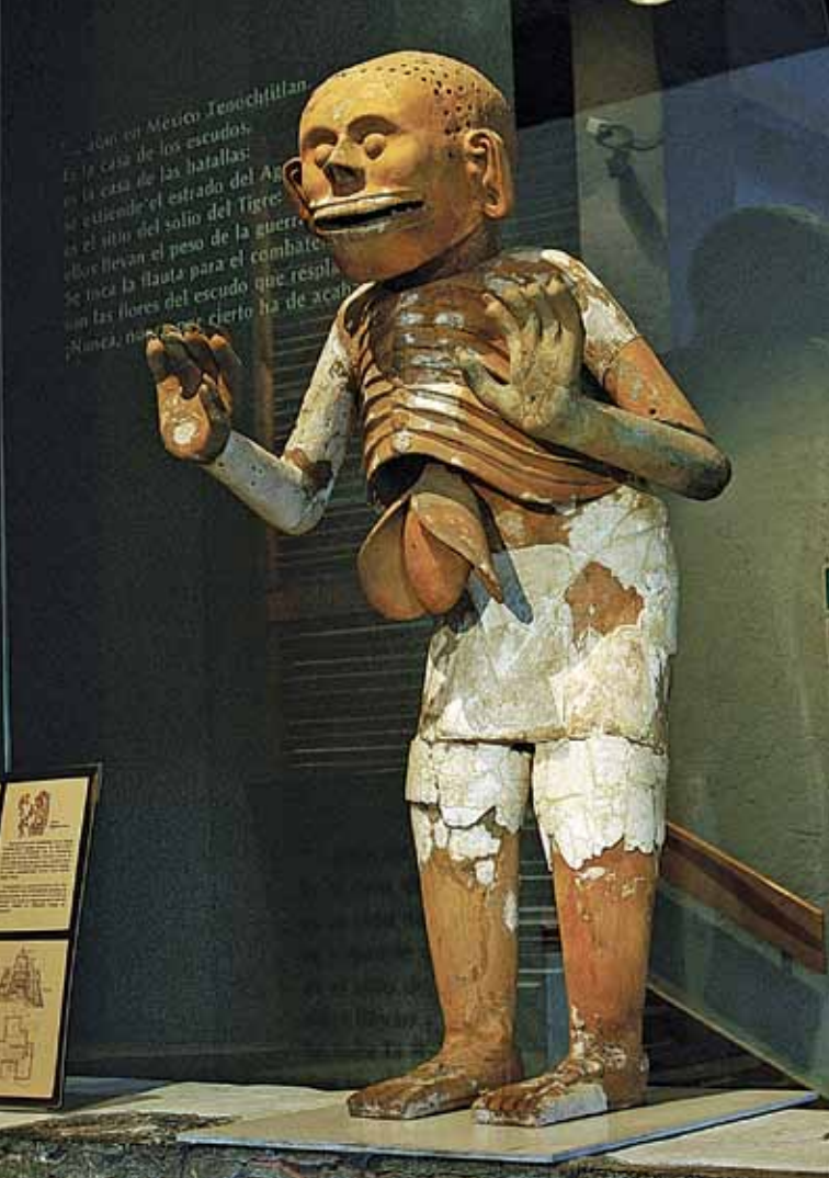
Templo Mayor.

Christi, la antigua casa de los Condes de Guardiola, el viejo Hospital franciscano de terceros, el edificio que albergaba el convento de Santa Isabel o la plaza de la Santa Veracruz, así como la Alameda Central, construcciones, todas ellas, que existieron en este espacioso lugar.