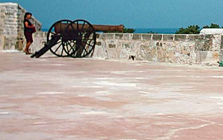
Fuerte de San Miguel, Campeche.

zación maya, por lo tanto es uno de los estados de la República Mexicana con mayor número de ciudades prehispánicas, entre las que destacan Calakmul, la ciudad maya más extensa y que actualmente se encuentra enclavada en el centro de la Reserva de la Biosfera del mismo nombre. Otra zona arqueológica relevante es Edzná conocida también como la casa de los Gestos, única ciudad maya con un edificio de cinco pisos. Por otra parte, la propia ciudad de Campeche es un ejemplo de impactantes fortificaciones militares del siglo XVII y XVIII que fueron construidas en contra de ataques piratas, además de edificaciones arquitectónicas religiosas de la orden franciscana del siglo XVI.