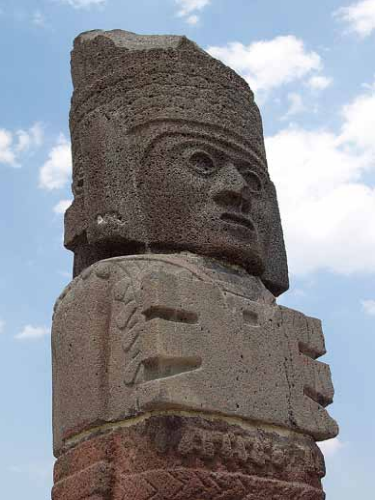
Tula, Hidalgo.

para visitar la Plaza de armas, la Parroquia de San José y el Palacio de Gobierno.