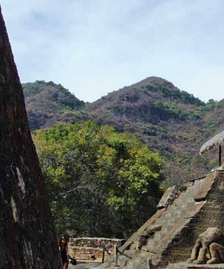
Zona arqueológica de Malinalco.

hasta ya entrada Centroamérica. También se visitarán el Conjunto Ajaracas, el Museo de la Caricatura y las criptas de la Catedral Metropolitana, por mencionar algunos lugares.