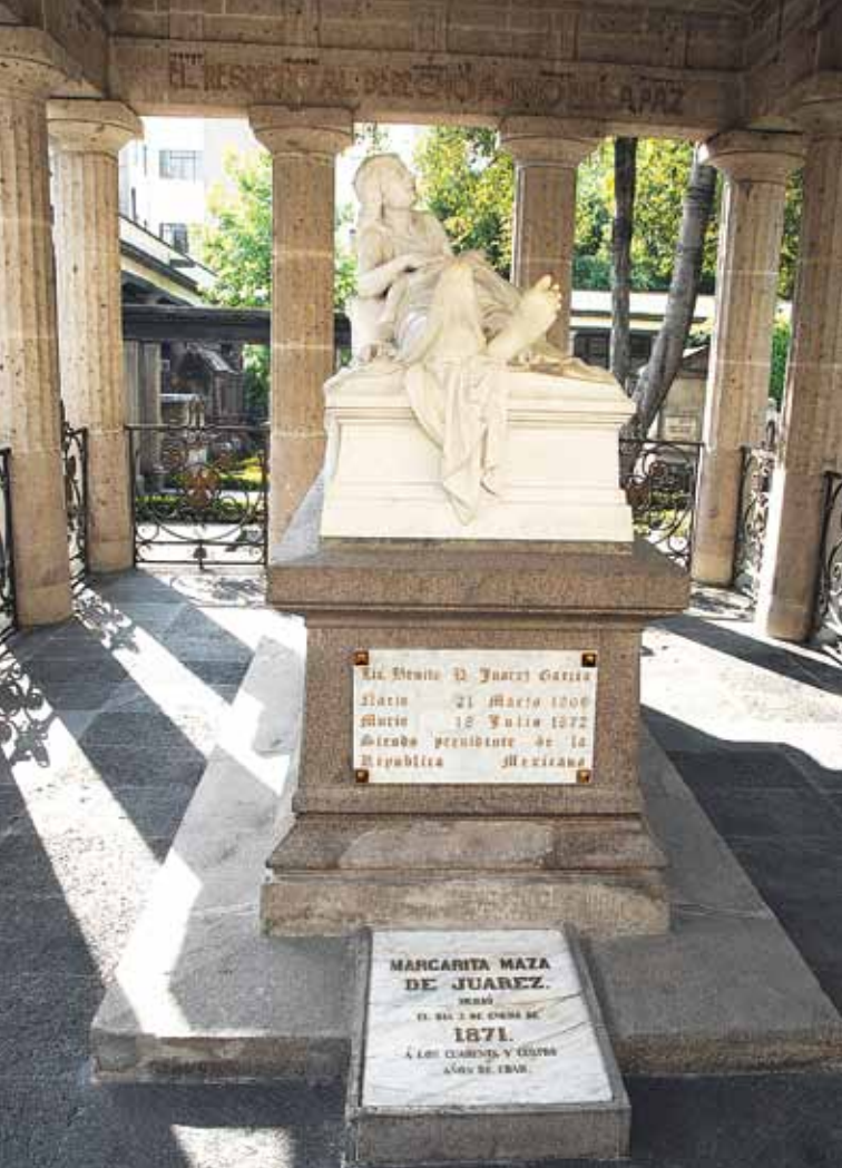
Panteón de San Fernando. Tumba de Benito Juárez.

sico superior hasta fines del cretácico (245 a 65 millones de años atrás). Su desaparición marca el límite entre la era mesozoica y la cenozoica, y el comienzo de la era de los mamíferos. El término dinosaurio en griego significa “lagarto terrible” y se refiere a ejemplares de lo más diversos: grandes, como el brontosaurio, que pesaba cerca de 75 toneladas, y muy pequeños, como el saltopus, de tan sólo 50 cm de largo.