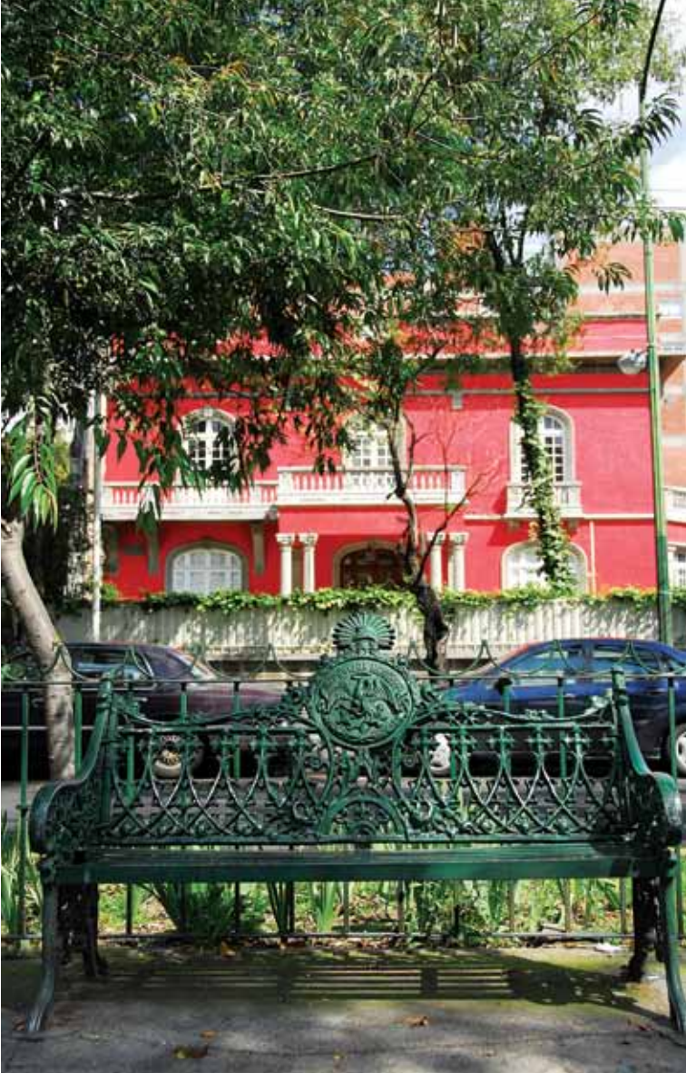
Colonia Condesa.

nómicos y artísticos que dieron lugar al moderno diseño urbano de esta colonia y la propagación de los estilos historicista, art nouveau , art deco y neocolonial en la arquitectura habitacional del barrio.